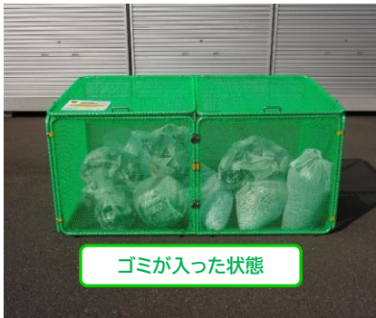
ゴミが入った状態